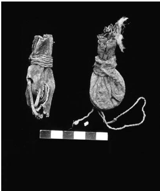
Figura 4. Receptáculos de vejiga, conteniendo colorantes, sitio CAM 15-D.

Bladder recipients containing color substances, site CAM 15-D.