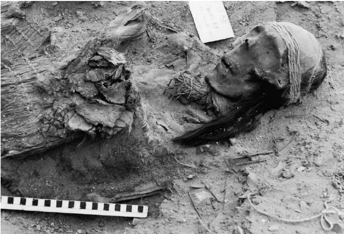
Figura 2. Entierro 23, sitio Camarones (CAM 15-D), cuerpo correspondiente a la tradición Chinchorro. Burial 23, Camarones site (CAM 15-D), body corresponding to the Chinchorro tradition.