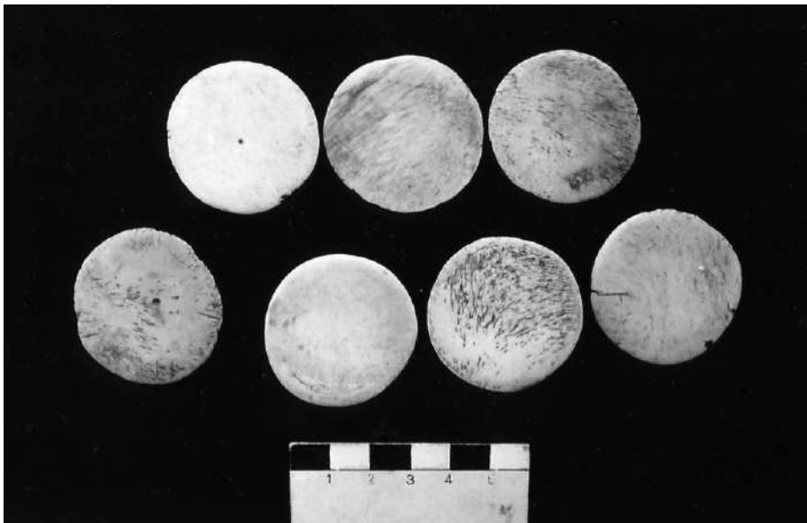
Figura 3. Parte del ajuar del entierro 23, sitio CAM 15-D, correspondiente a discos de hueso probablemente parte de una diadema u ornamento cefálico. Items of the offering belonging to burial 23, CAM 15-D site, corresponding to bone discs probably section of diadem or head ornament.